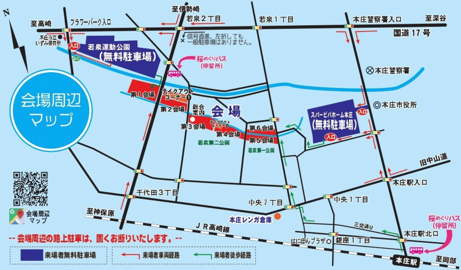
写真は第4回の様子です。

2025年 3月29 Sat 10:00 ~ 16:00 30 Sun 10:00 ~ 15:00